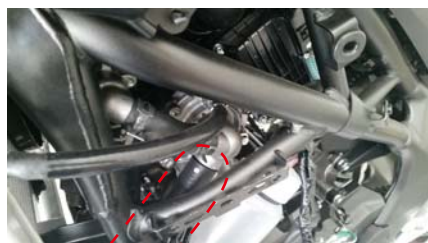
カットするホース