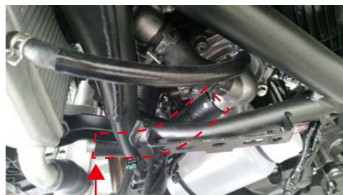
ホース A (注※見やすいようにホースバンドを外しています)