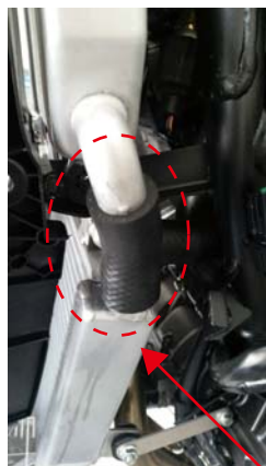
ホース B (注※見やすいようにホースバンドを外しています)