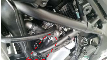
カットするホース